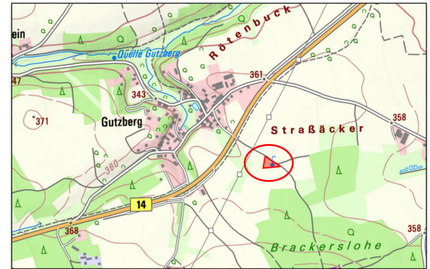
Übersichtslageplan M 1:10.000, Bayernatlas