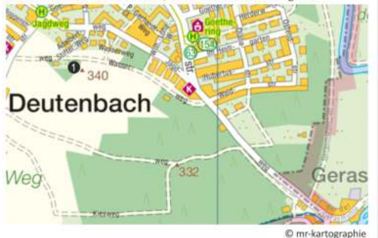
Kartenausschnitt für Station 1, da außerhalb des Kerngebietes

Bitte beachten Sie die neue Uhrzeit von 13 – 17 Uhr