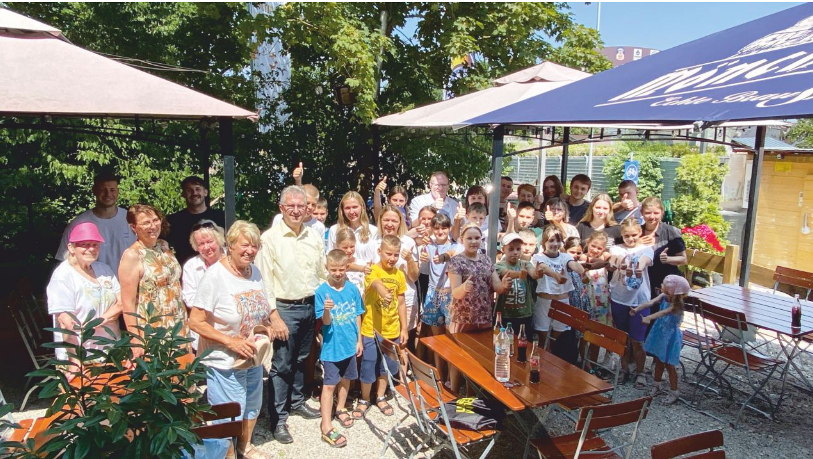
Groß ist die Freude aller über den Besuch der Kinder aus Tschernobyl in Stein.