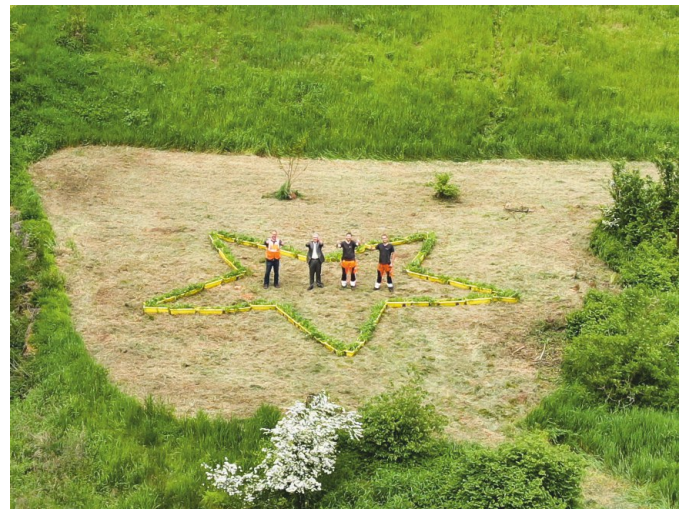
Mitarbeiter der Stadtgärtnerei und Erster Bürgermeister Kurt Krömer inmitten des Europasterns im Steiner Wiesengrund.

Waren und sind es normalerweise zehn bienenfreundlich bepflanzte Beedabei-Blumenkästen, stockte die Stadt Stein in diesem Jahr auf 50 Balkonkästen auf. Der große Stern fand am 16. Mai seinen Platz im Steiner Wiesengrund. Damit alle etwas davon haben, wurden die Kästen anschließend am Samstag, den 20. Mai 2023, dem Weltbienentag, von Bürgermeister Kurt Krömer am FORUM gegen eine Spende an die Bürgerstiftung Stein an Bürger:innen übergeben. „Wir unterstützen diese tolle Aktion sehr gerne. Mit zahlreichen Blühwiesen und unseren Blumenampeln entlang der Hauptstraße – um nur zwei Beispiele zu nennen – sind uns Nahrungsplätze für die Insekten allerdings nicht nur am Weltbienentag wichtig. Deshalb war es mir ein großes Anliegen, dass diese Kästen im gesamten Stadtgebiet bei den Steiner Bürger:innen ein Zuhause finden.“ Der Erlös aus den Spenden für die insgesamt 22 verteilten Blumenkästen geht an die Steiner Bürgerstiftung, die mit dem Geld soziale Zwecke in der Stadt Stein unterstützt.