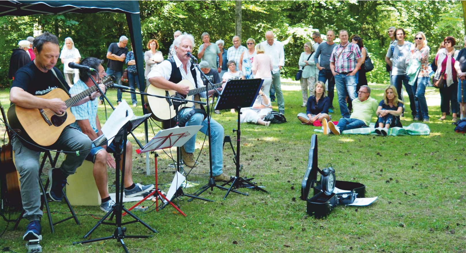
Klänge aus verschiedenen Musikrichtungen laden bei „Der Stadtpark klingt“ zum Verweilen und Lauschen ein.