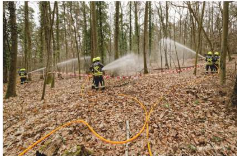
Die Brandbekämpfung nachdem die Schlauchstrecke in das Gebiet gelegt wurde.

Zur Einsatzabwicklung wurde der Großteil der Einsatzkräfte zunächst in den Bereitstellungsraum am Besucherparkplatz von Faber-Castell geordert, während der Einsatzleitwagen (ELW) und das erste Löschfahrzeug zur Erkundung bereits in den Wiesengrund vorfuhren. Nach der Ersteinschätzung der Lage wurden die Fahrzeuge nach und nach zu ihren jeweiligen Einsatzorten abgerufen: Ein Teil der Kräfte übernahm mit zwei Tragkraftspritzen die Wasserentnahme aus der Rednitz in Faltbehälter. Die weiteren Feuerwehrleute fuhren der Anweisung entsprechend von zwei Seiten die Brandfläche an und begannen von dort aus mit dem Löschaufbau. Eine Herausforderung dabei war das unwegsame Gelände und die vergleichsweise langen Strecken zwischen den Fahrzeugen auf dem asphaltierten Weg und der Brandfläche im Waldgebiet. Nachdem die Schlauchstrecke in das betroffene Gebiet gelegt wurde, konnte die Brandbekämpfung gestartet werden. Nachdem bei einem Wald- oder Flächenbrand ein erhöhter Löschwasserbedarf besteht, wurde neben den Feuerwehren auch eine lokale Firma mit zwei Traktoren und großen Wasserfässern in die Löschwasserversorgung eingebunden. Mit dem eingerichteten Pendelverkehr der wasserführenden Fahrzeuge wurde die Wasserversorgung sichergestellt. Die Vielzahl der Einsatzkräfte stellte die Einsatzleitung vor eine organisatorische Herausforderung. Um die Lage im Blick zu behalten, teilte die Einsatzleitung das Ge-