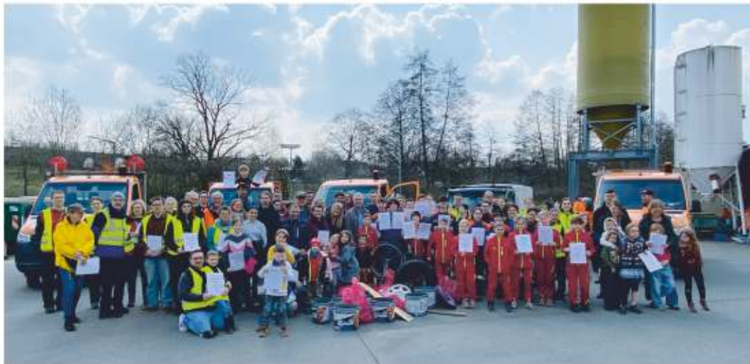
Über achtzig große und kleine Helfer beteiligten sich in diesem Jahr an der „Aktion Saubere Landschaft“.

Im Rahmen der landkreisweiten „Aktion Saubere Landschaft“ versammelten sich am 21. März über 80 engagierte große und kleine Helferinnen und Helfer am Bauhof der Stadt Stein. Gemeinsam machten sie sich daran, Wälder, Wiesen und Wege von achtlos entsorgtem Müll und Unrat zu befreien. Bereits zum 57. Mal fand die Aktion statt – ein deutliches Zeichen dafür, dass dieses Engagement nach wie vor dringend notwendig ist, da es leider noch immer vielen Menschen schwerfällt, Abfälle ordnungsgemäß zu entsorgen.