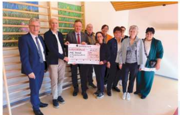
Große Freude über die finanzielle Zuwendung durch die Landkreisstiftung.