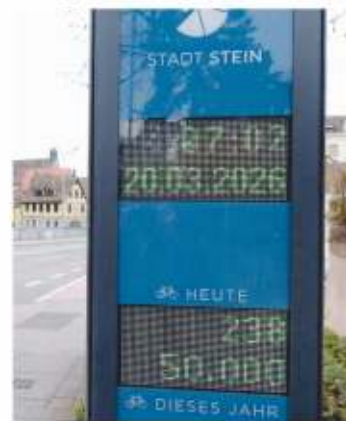
An der Zählstation an der Rednitz wurde am Freitag, 20. März der oder die 50.000 Radfahrer/in gezählt.

„Die hohe Zahl an Radfahrerinnen und Radfahrern zeigt deutlich, dass unsere Maßnahmen für eine fahrradfreundliche Stadt greifen. Stein setzt konsequent auf den Ausbau und die Verbesserung der Radinfrastruktur. Die Marke von 50.000 Radfahrten ist ein starkes Signal für nachhaltige Mobilität in