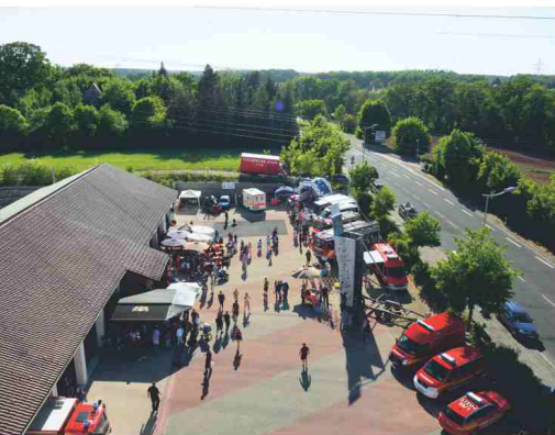
Die FFW Stein lädt am Stadtfest-Sonntag zum Floriansfest

statt und auf dem Martin-Luther-Platz vollführen die Steiner Schlossgeister ab 17.30 Uhr beeindruckende Tänze und Kunststücke. Beste Voraussetzungen für ein buntes und vielfältiges Stadtfest 2019!