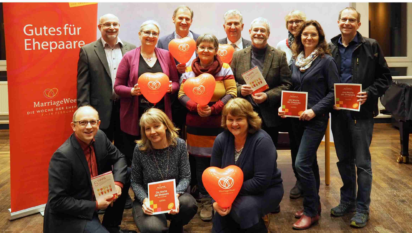
Gemeinsam haben sie ein buntes Angebot ausgetüftelt. Die Mitarbeiter der christlichen Gemeinden in Stein und ihre Unterstützer aus Einrichtungen und Geschäften in Stein freuen sich auf die MarriageWeek 2019.