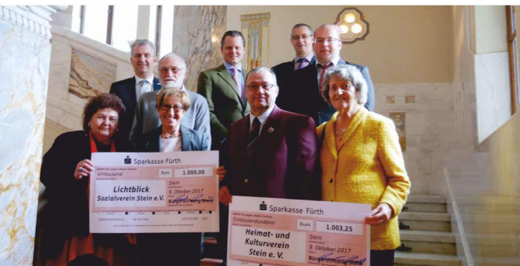
Spendenausschüttung 2017 an den Sozialverein Lichtblick und den Heimat- und Kulturverein Stein.

und unterstützen damit Steiner Vereine, Organisationen, Institutionen und gemeinnützige Projekte. Mit der Entscheidung des Steiner Stadtrates, die Bürgerstiftung Stein mit 10.000 Euro auszustatten, wurde der Grundstein für die erste kommunale Bürgerstiftung im Landkreis Fürth gelegt.