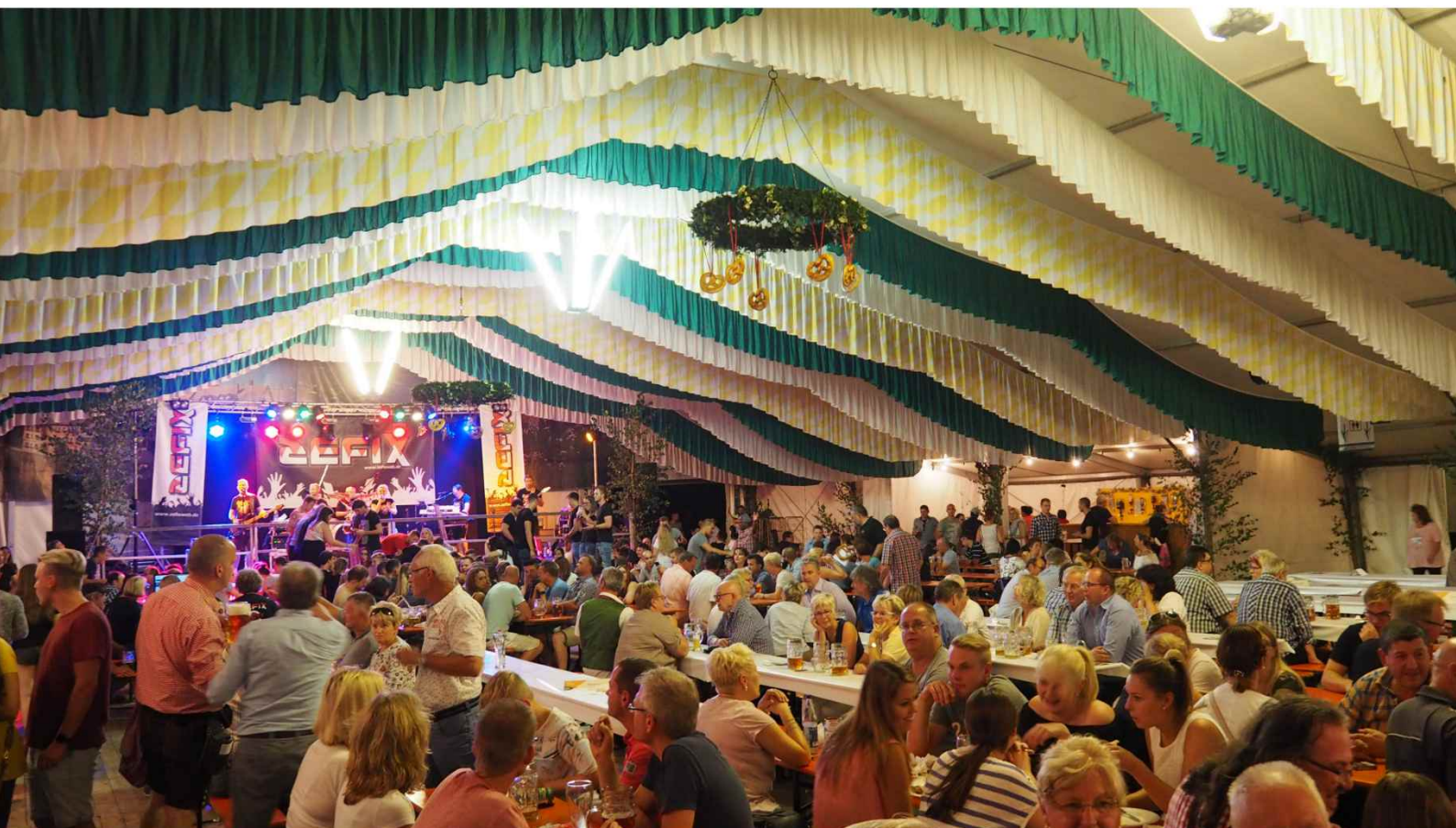
Am 24. August startet die Steiner Kirchweih auf dem Festplatz. Dann locken fünf Tage lang wieder Kärwa-Köstlichkeiten, ein vielseitiges Programm und gute Stimmung ins Festzelt.