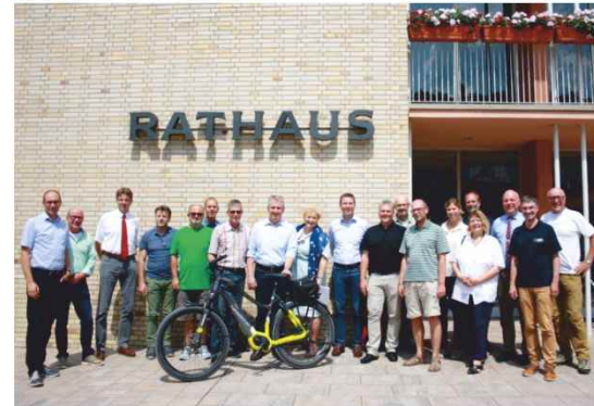
Die Bewertungskommission zu Gast in Stein.

Die Auszeichnung wird seitens der Verwaltung als Ansporn verstanden, sich kontinuierlich für die Belange des Radverkehrs in der Stadt Stein einzusetzen. Das Erreichte muss in den nächsten sieben Jahren fortgeführt werden, damit auch im Jahr 2025 der Titel "Fahrradfreundliche Kommune" nicht gefährdet ist.