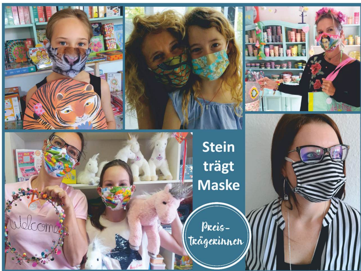
Gestaltung: Monika Hetterich

Der Fotowettbewerb läuft zunächst bis zum 15. Juli 2020. Viel Spaß beim Mitmachen!