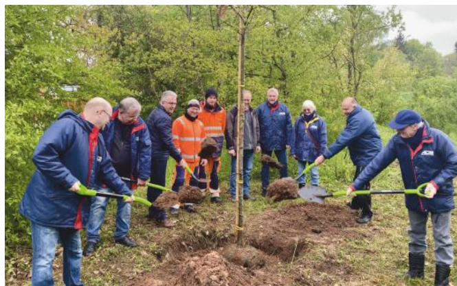
Mitarbeiter der Stadtgärtnerei und Mitglieder des AC Stein pflanzen im Beisein von Erstem Bürgermeister Kurt Krömer (3.v.l.) die Esskastanie am Fasanenring.

Hierzu ist ein kurzer Rückblick nötig: Vor rund vier Jahren, am 24. Februar 2020 wurde am Kirchweihplatz symbolisch ein Baum gepflanzt. Symbolisch deshalb, da das Ansetzen der Blumen-Esche der Auftakt zu weiteren deutlich mehr als 100 Baumpflanzungen war. Das Ziel des Automobilclub Stein dahinter ist, als erster Veranstalter von Classic Rallyes in Deutschland klimaneutral zu sein. Jetzt, vier Jahre später, wurden im Beisein von Erstem Bürgermeister Kurt Krömer drei weitere Bäume gepflanzt, um dieses Ziel zu verwirklichen. Mit Unterstützung der Stadt Stein und der Stadtgärtnerei ist die Klimaneutralität der Metz-Rallye somit auf dem besten Weg. Kurt Krömer ist von dem Einsatz begeistert: „Die Metz-Rallye ist ein wichtiger Termin im Veranstaltungskalender, auf den wir nicht verzichten möchten. Aber in Zeiten des Klimawandels ist auch ein verantwortliches