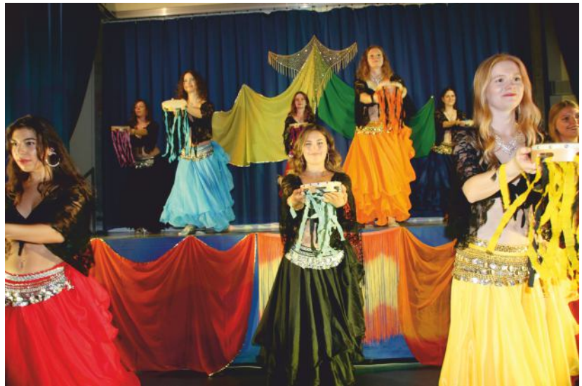
Die "Töchter der Wüste" beim Auftritt im vergangenen Jahr.