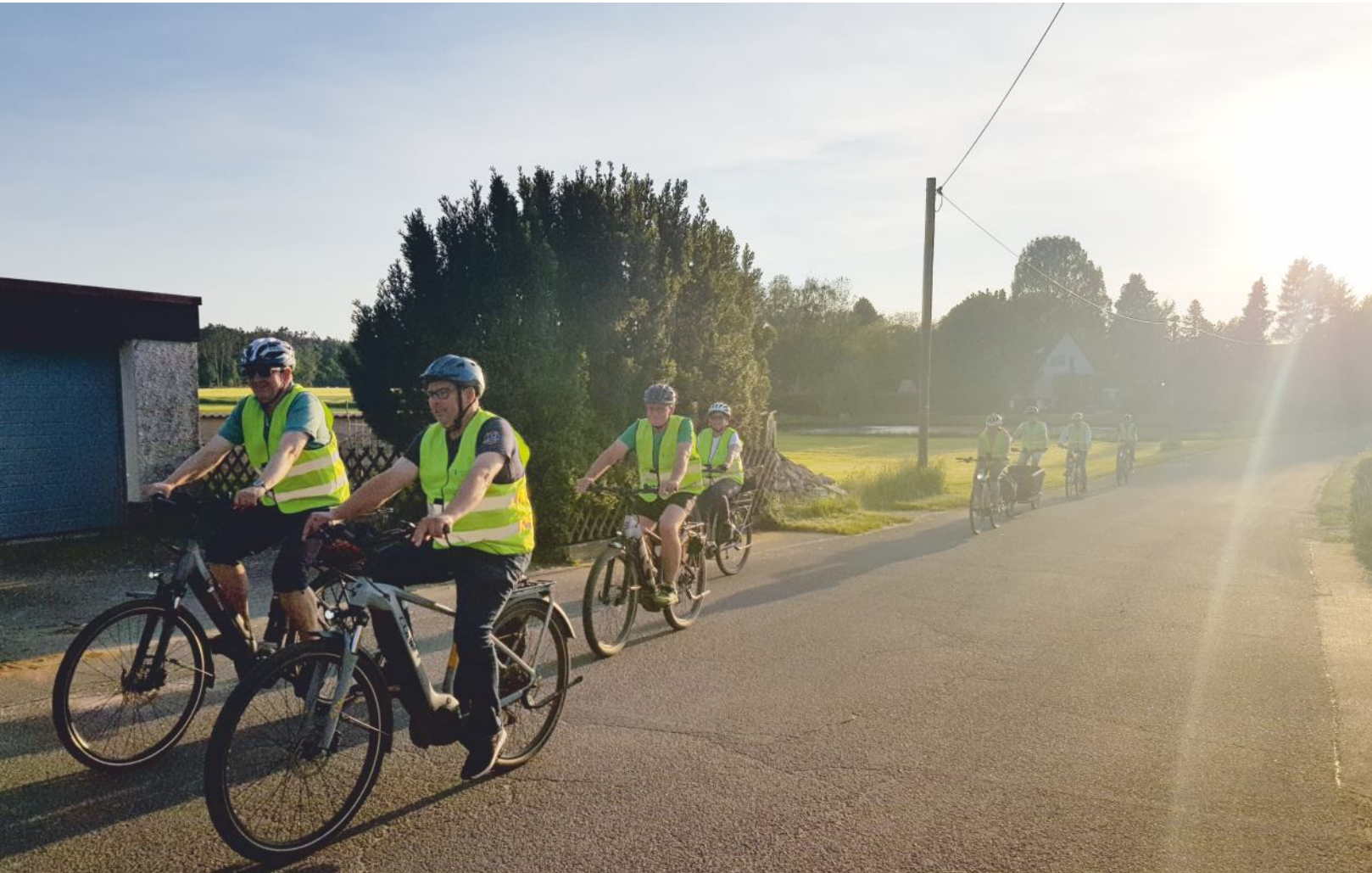
Am 3. Juni beginnt das STADTRADELN 2024.