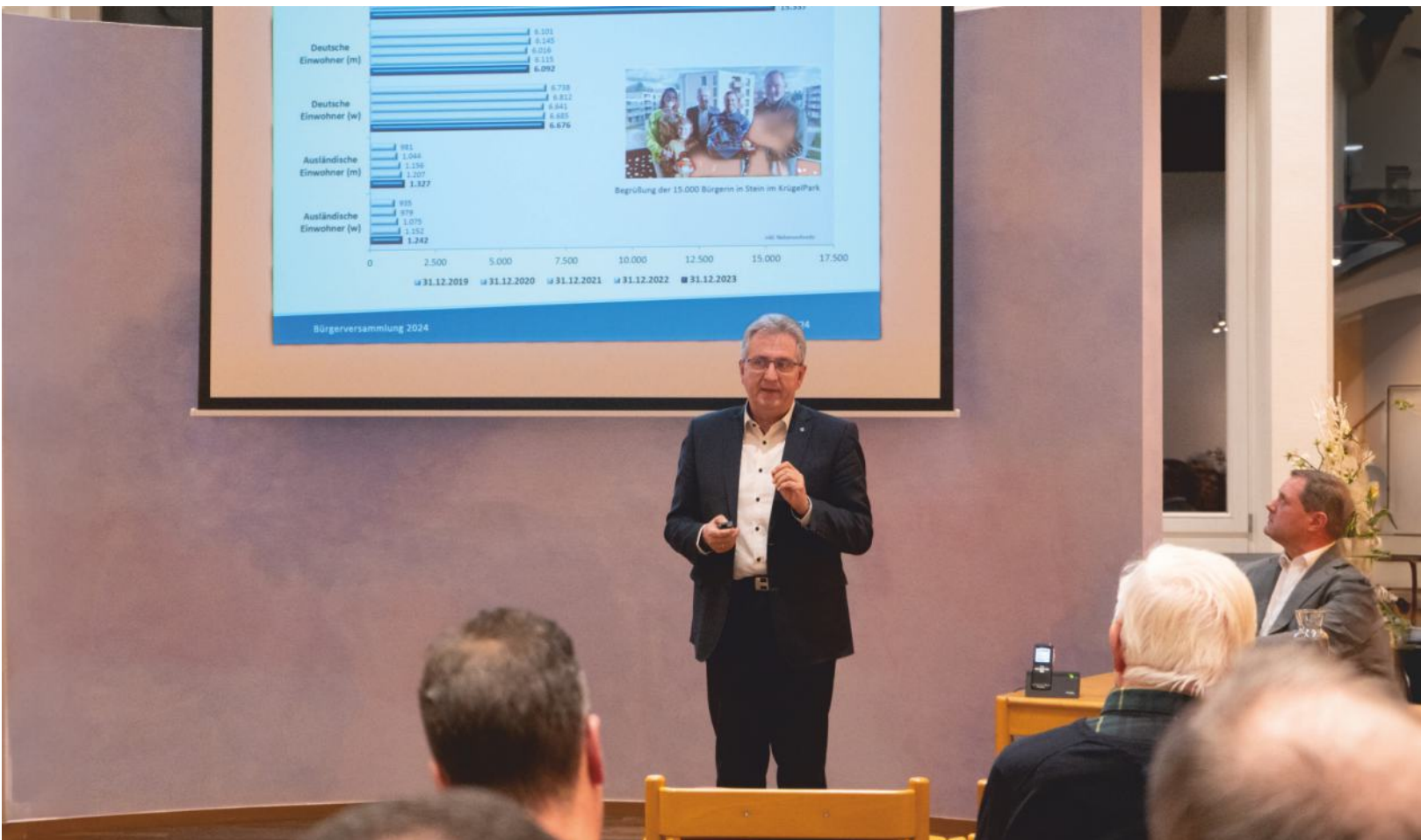
Der Bericht des Ersten Bürgermeisters Kurt Krömer bei der Bürgerversammlung im Rathaus.