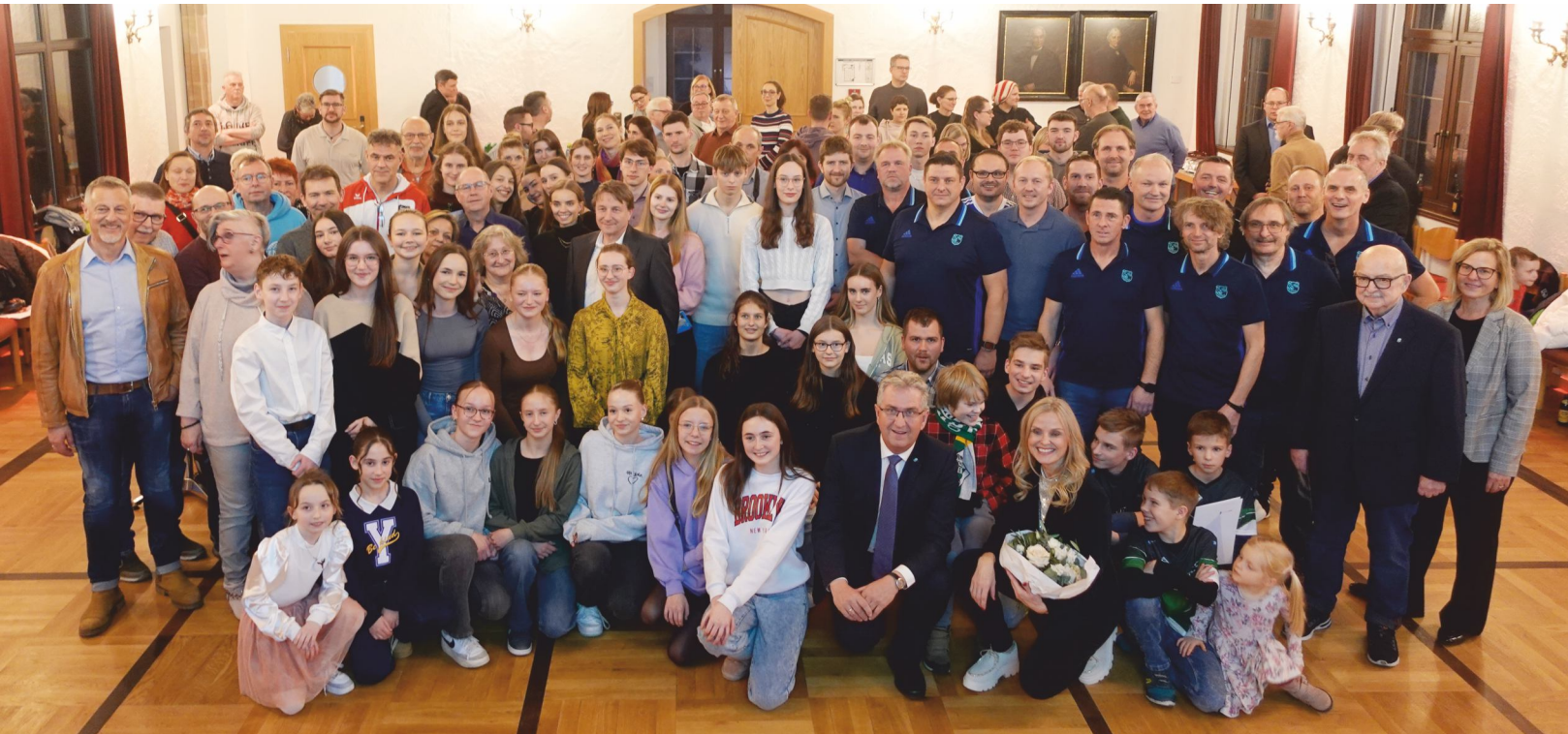
Geehrt wurden die Sportlerinnen und Sportler in der Alten Kirche Stein.