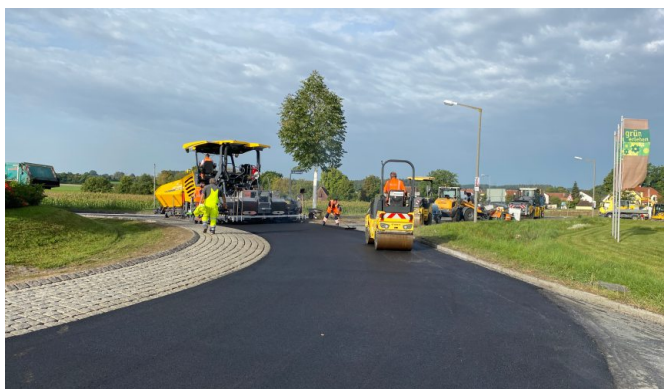
Die Arbeiten auf der B 14 gehen gut voran.

Der Fahrbahnbelag weist in diesem Abschnitt vermehrt Verdrückungen und Querrisse auf, die sich über die gesamte Fahrbahnbreite erstrecken. Auch die Fahrbahnfläche des Kreisverkehrsplatzes der B 14 auf Höhe der Hofäckerweg in Stein ist betroffen. Um die Arbeiten schnellstmöglich durchführen zu können, wird in der Zeit von 6 Uhr bis teilweise in die Dunkelheit um 21 Uhr gearbeitet. Dabei wird der alte Straßenbelag bis zu einer Tiefe von zehn Zentimetern abgefräst und dann eine neue Asphaltdecke eingebaut. Die Erneuerung wird auf einer Länge von rund 700 Meter in vier Bauabschnitten und unter einer halbseitigen Verkehrsführung mit einer Ampelregelung durchgeführt, so dass stets ein Fahrstreifen wechselseitig befahrbar ist. Für jeden Bauabschnitt ist etwa eine Woche terminiert. Im Rahmen der