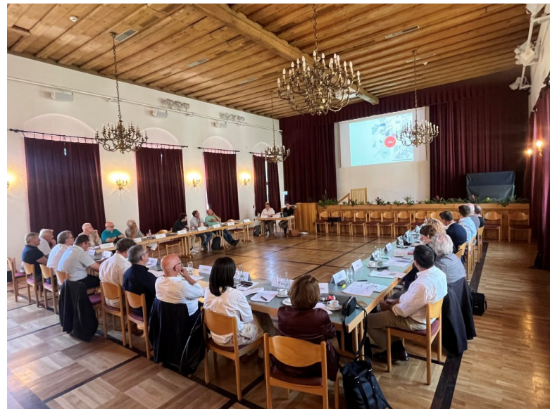
Vorbesprechung der Fachjury.

Atelier Starzak Strebicki, Posen mit mk. Pracownia Architektury Krajobrazu, Warschau / blrm Architekt*innen GmbH, Hamburg – mit rabe landschaften, Hamburg / Hepp + Zenner Ingenieurge-