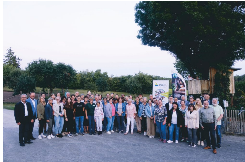
Die strahlenden Gewinner und Beteiligten des HofladenQuiz 2023.